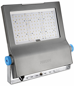
BVP650 - LED EconomyLine