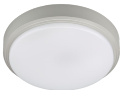
CoreLine Wall-mounted WL140V Ceiling-mounted Grey