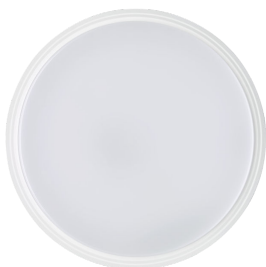
Coreline Wall-mounted WL140V Top View