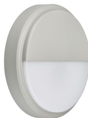
CoreLine Wall-mounted WL140V Wall-mounted Grey with Half- moon Accessory