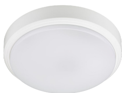
CoreLine Wall-mounted WL140V Ceiling-mounted