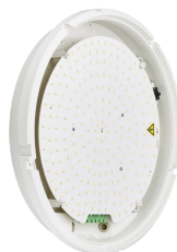
CoreLine Wall-mounted WL140V Wall-mounted Switchable Lumen & CCT