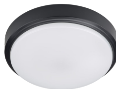
CoreLine Wall-mounted WL140V Ceiling-mounted Black