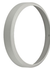
CoreLine Wall-mounted WL140V Rim Grey