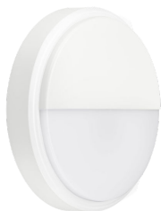
CoreLine Wall-mounted WL140V Wall-mounted White with Half- moon Accessory