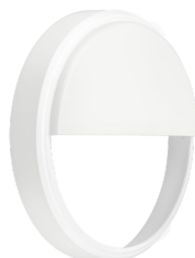
CoreLine Wall-mounted WL140V Half-moon Accessory White