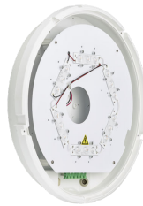
CoreLine Wall-mounted WL140V Wall-mounted PSU