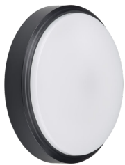
CoreLine Wall-mounted WL140V Wall-mounted Black