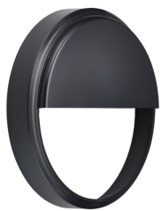
CoreLine Wall-mounted WL140V Half-moon Accessory Black