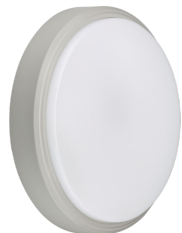
CoreLine Wall-mounted WL140V Wall-mounted Grey