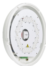
CoreLine Wall-mounted WL140V Wall-mounted PSR MDU