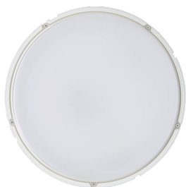
Coreline Wall-mounted WL140V Top View (with screw locations)