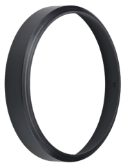
CoreLine Wall-mounted WL140V Rim Black