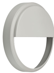
CoreLine Wall-mounted WL140V Half-moon Accessory Grey