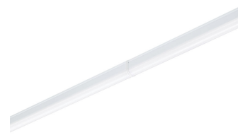
Ledinaire batten, BN021C, Light-line pin-to-pin