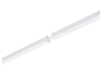
Ledinaire batten, BN021C, Light-line pin-to-pin