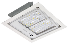
Mini 300 LED gen3