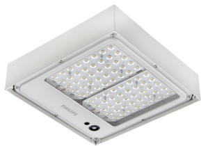
Mini 300 LED gen3