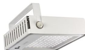
Mini300_gen3- BBP333_RM_with_accessory_kit- DPP.TIF