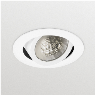
LuxSpace Accent Compact G3 - LED Module, system flux 1700 lm